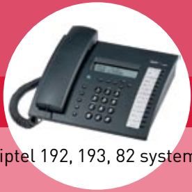
tiptel 192, 193, 82 system