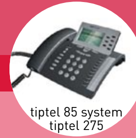
tiptel 85 system tiptel 275