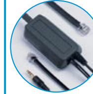
AP-1 P/N 36664-01

① N-Modelle: Noise Cancelling für laute Umgebung