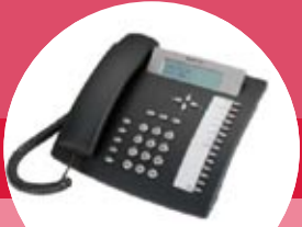
tiptel 192, 193, 292, 293, 82 system, 83 system tiptel ergovoice S/tiptel ergovoice CR