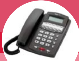
tiptel 160 tiptel 570 office