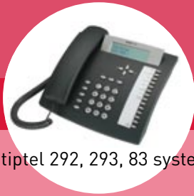
tiptel 292, 293, 83 system