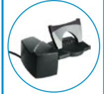
HL10 P/N 36390-11

① N-Modelle: Noise Cancelling für laute Umgebung