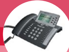
tiptel 85 system tiptel 275