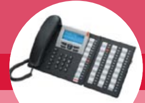
tiptel 65 system