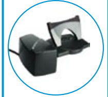
HL10 P/N 36390-11

① Unterstützt EHS Funktion. Bitte Systemvoraussetzungen beachten.