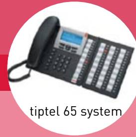
tiptel 65 system